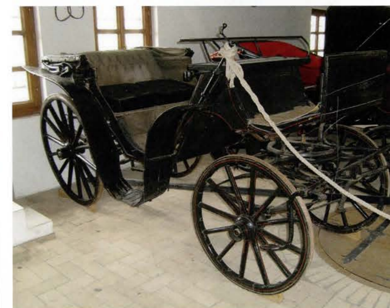
Ungern är ett av hästarnas hemland med uppfostring och dressyr. Vagn från Ungern. Foto 2008.

fanns i regel två till tre hästar. Torpen hade vanligen en häst. Så var det ända fram till 1950-talet då traktorer började säljas i Nora. Det var ex.v Fergusson och olika modeller av BM. Skogskörslor med häst