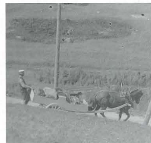
Häst med kärra på väg till Sandö. 1925. Klocke.