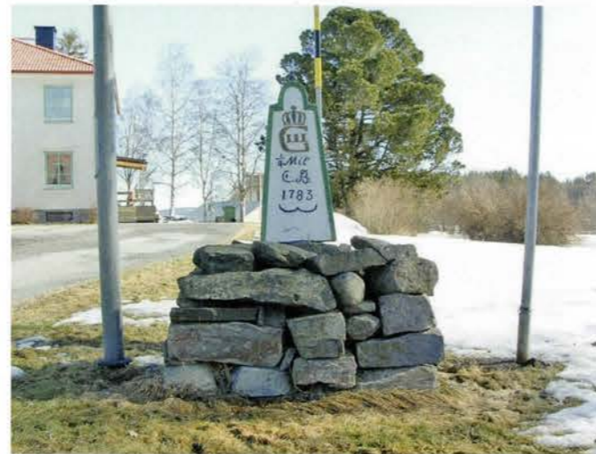
Kvartsmilsten i Nordvik.

Milstolpar sattes upp längs alla större vägar på kvartsmil, halvmil och hel mil. Det var reglerat i 1649 års gästgivarförordning. Milstolparna skulle visa vägen och ange avståndet. Dessutom var milstolparna grund för den skjutspenning (taxa) som bonden fick ta ut av resenären. I stället för att utföra gratis skjutsningar (friskjutsar) blev bönderna i stället skyldiga att betala en skatt, skjutsfärdspengar. Bonden fick efter lagen 1649 ta ut ersättning av resenärerna, skjutspenning, men hade fortfarande skyldighet att ställa upp med hästar. Det var även föreskrivet att en häst fick köra