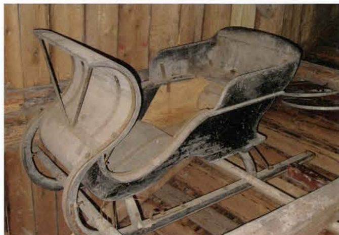
Enmansläde i Klocke. Foto 2008.