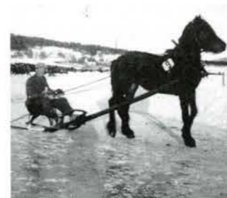
Isbanetravet på Storsjön i Skog.