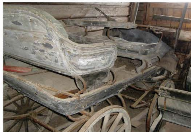
Fjädertrilla i Klocke. Foto 2008.