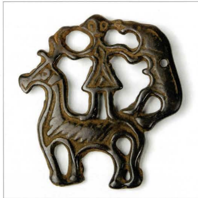
Samiskt bronsbeslag med dödsguden Rota till häst.

I Nämforsen finns en liten häst nere till vänster, med samma formspråk som hästarna i Trondheimsfjorden.