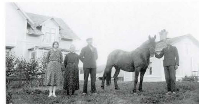
Familjebild hos Saltins i Ry. Foto 1945.