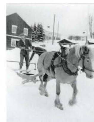
Snöplogning med häst, 1957. Klocke.