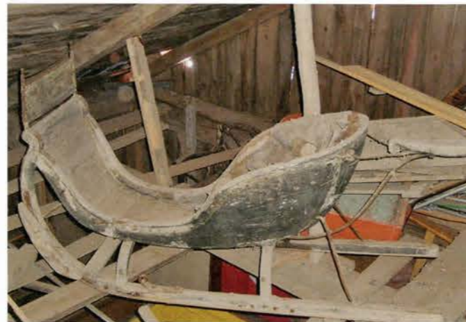
Kappsläde i Klocke. Foto 2008.