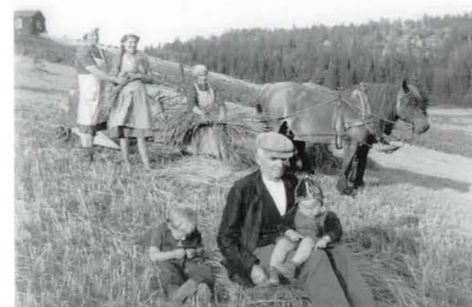
Två hästar drar självbindaren i branta Klockebackarna. Klocke 1945.