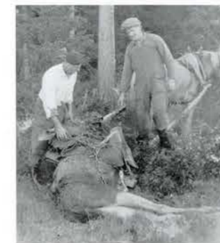
Ålg körs fram ur skogen, 1957. Klocke.