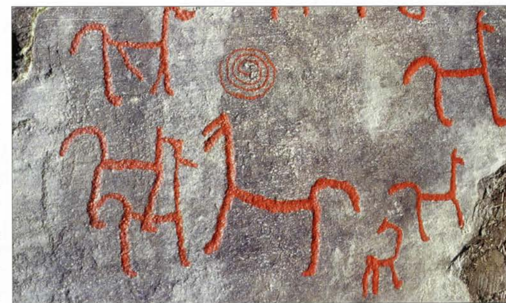
På klipporna i det inre av Trondheimsfjorden finns ett stort antal hästfigurer inristade.