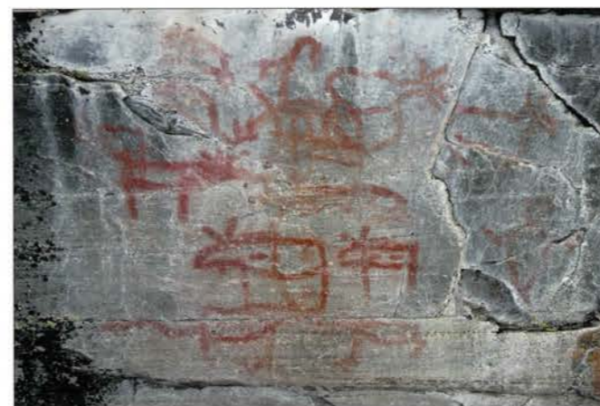
Bland figurerna i hållmålningen på Flatruet gömmer sig en hästliknande figur i översta raden. Den har huvudet vänt åt höger, små öron (jämför med älgarna), karaktäristiskt böjd nacke, rak rygg och raka ben.