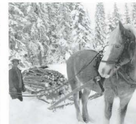
Vedlass på vinterväg, 1955. Klocke.