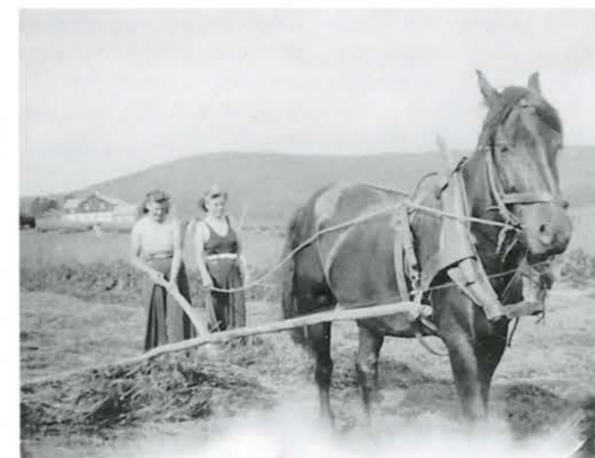
Häst med släpräfsa i Grubbe. Signe Melander kör. Foto 1945