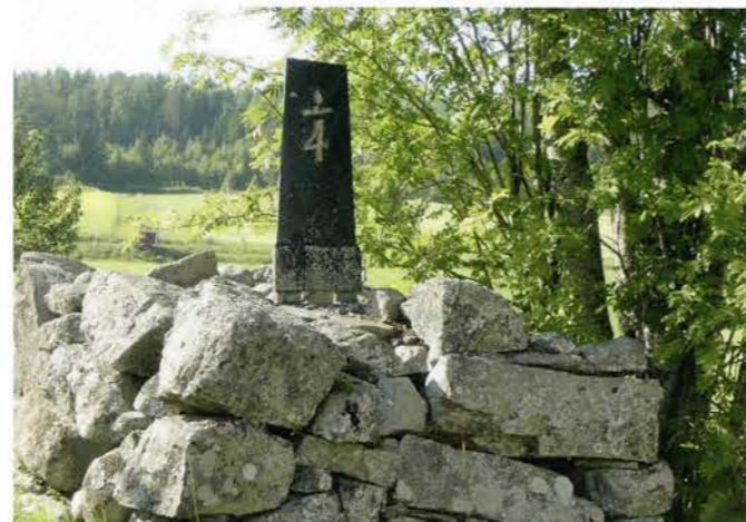
Kvartsmilsten på Prästbodet i Torrom.

med en hastighet på högst 1 mil på 1,5 timmar.