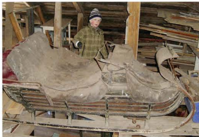
Rissla i Klocke. Foto 2008.