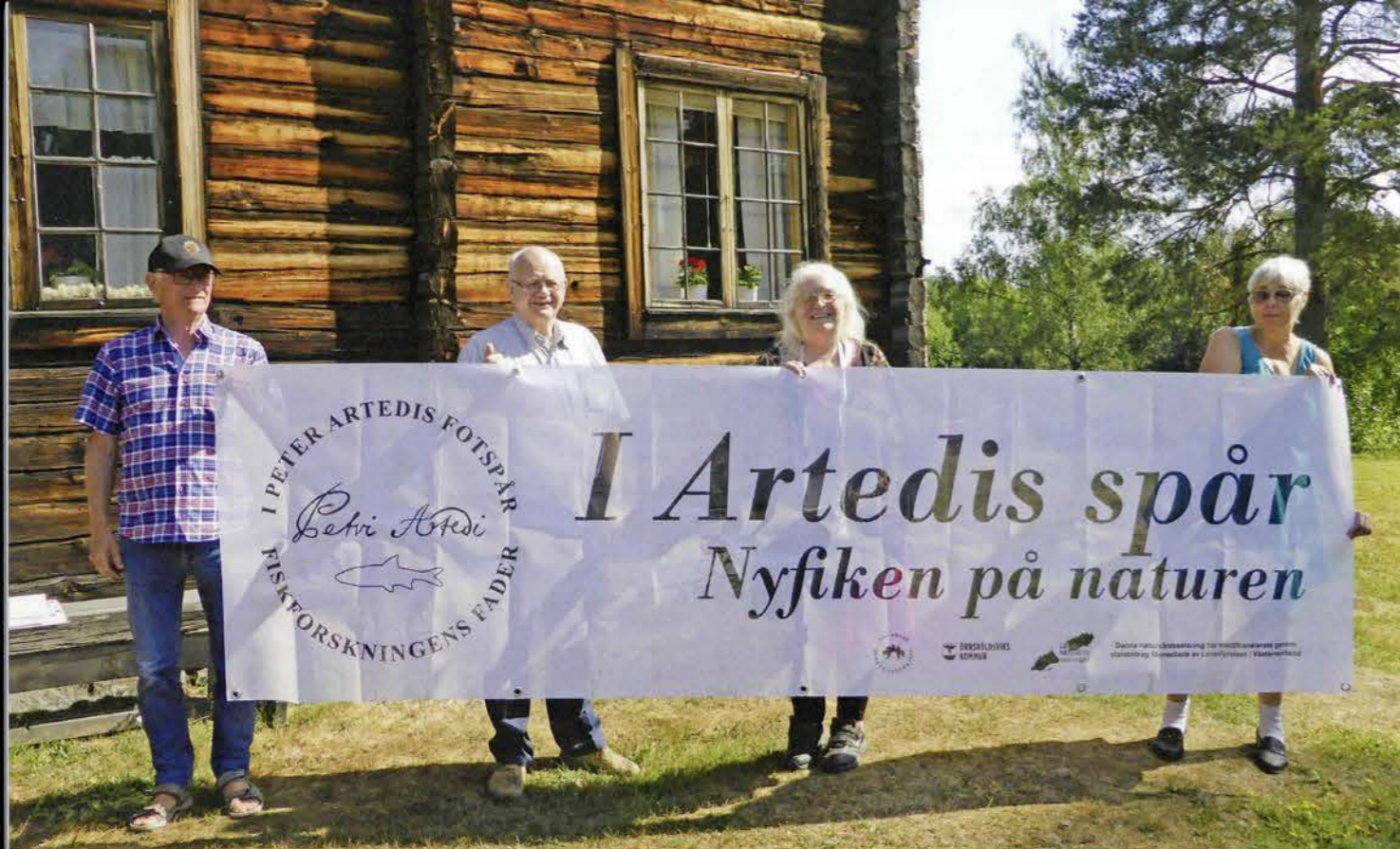
Under föredraget visades bra exempel på lokalt arbete med tema Peter Artedi. Del av arbetsgruppen i Artedikommittén inom Anundsjö hembygdsförening visar nytillverkad banderoll för publika tillfällen.