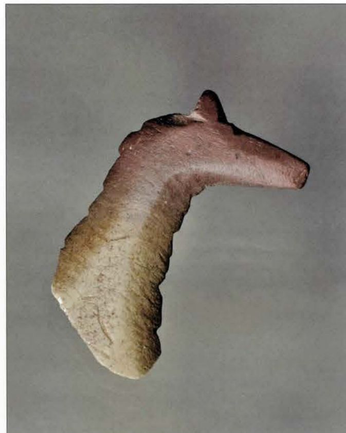
Hästliknande figur från Hälla i Åsele sn, Lappland.

Ytterligare en hästliknande figur hittar vi bland de avbildade djuren i hållmålningen på Flatruet i Härjedalen. Bland de korthalsade och storörade älgarna gömmer sig en figur med lång smal hals, krum nacke, litet huvud och små spetsade öron. Ryggen och benen är raka. Avbildningen är mycket lik de hästar som i stort antal är ristade på klip-