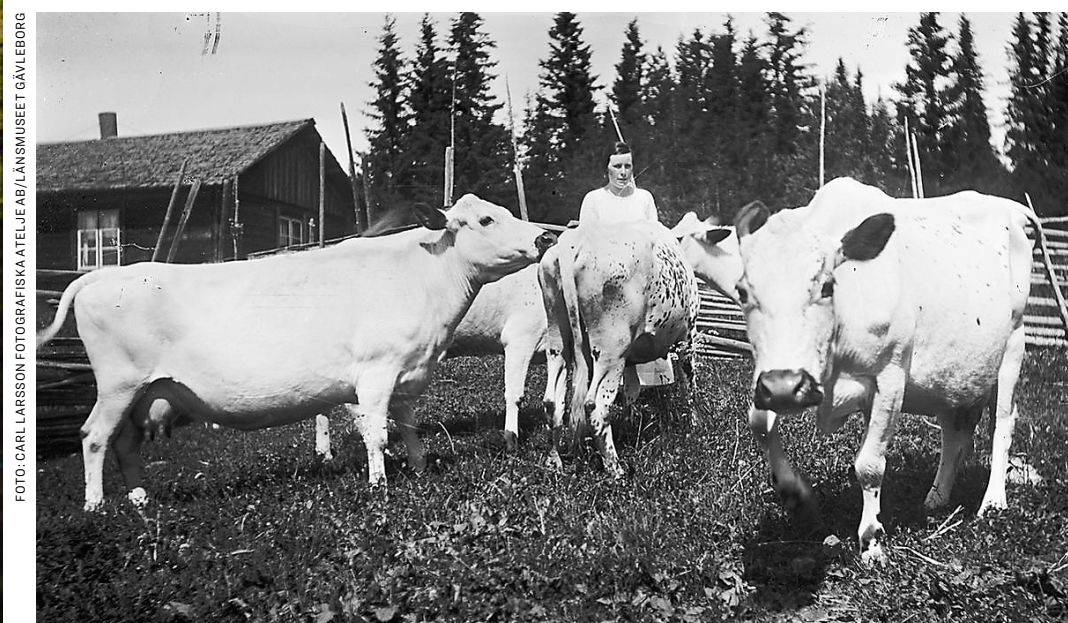
Förr i tiden hade i stort sett alla i Norrland sina egna fjällkor.

”Fjällkon är den sista resten av det jordbruk som bedrivits i Norrland.”