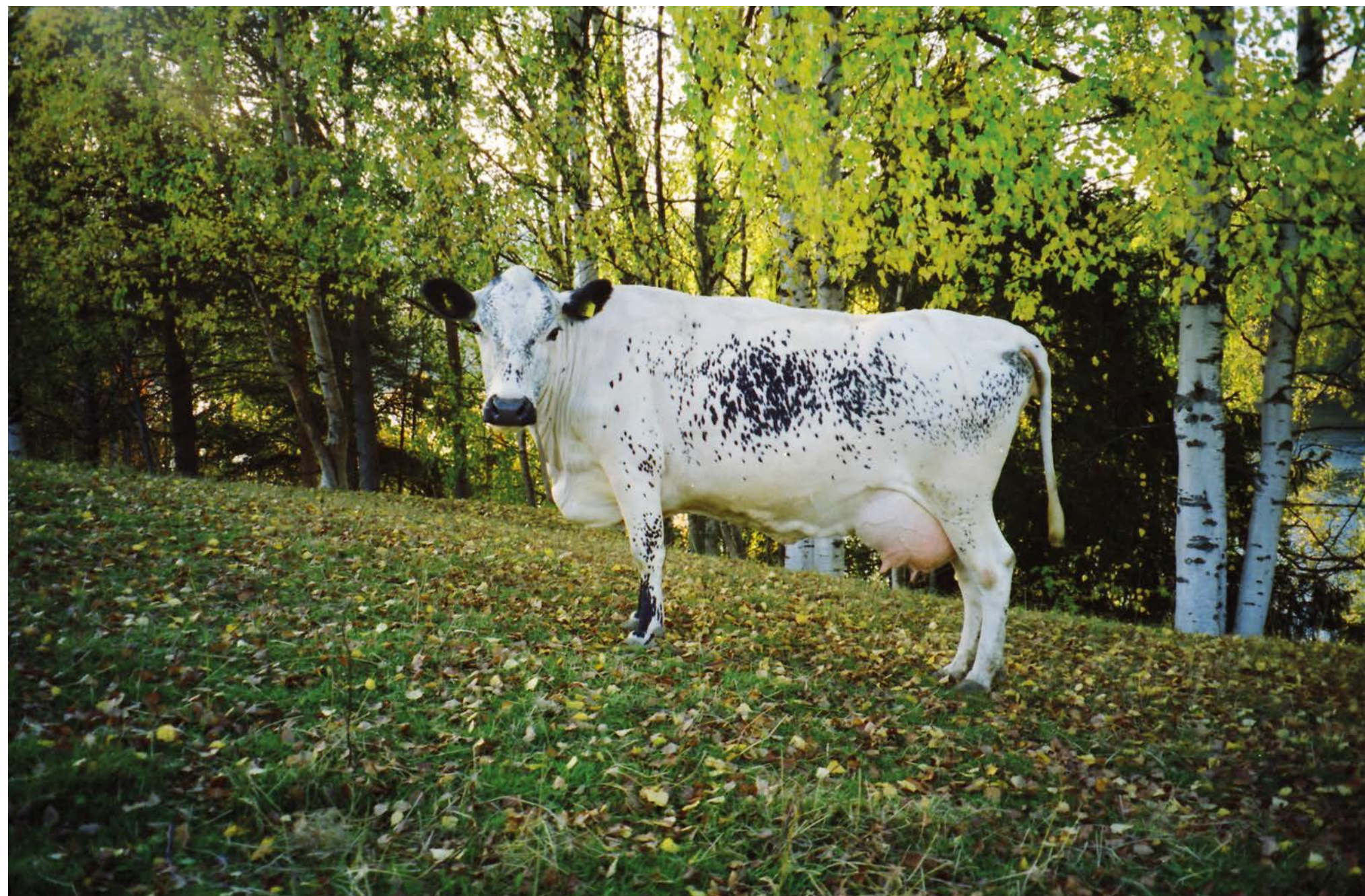
I dag finns färre än 400 fjällkor i Sverige.

Fjällkorna anses vara norra Sveriges ursprungliga koras. Den ko som i dag är i majoritet är en ras framavlade av importörer för att passa det svenska klimatet. Samtidigt är den ursprungliga svenska korasen på väg att försvinna.